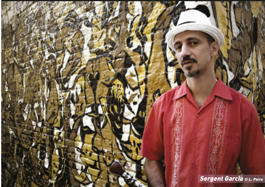
Sergent Garcia

Balkans, Espagne, Italie, Maghreb, Sud de l'Europe et même des Amériques... le festival "Méditerranéo" nous invite à la rencontre des racines métissées du bassin méditerranéen. Une évasion musicale multicolore et conviviale!