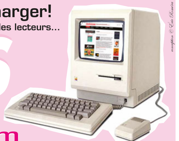
conception © Eric Roméra