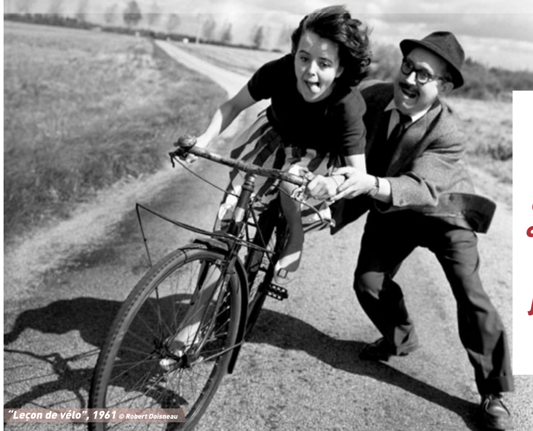
“Leçon de vélo”, 1961 © Robert Doisneau

La prochaine exposition qu'accueillera la galerie du Château d'Eau célèbre l'amitié qui liait les photographes Jean Dieuzaide et Robert Doisneau.