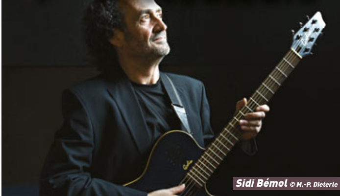
Sidi Bémol

L'association Dell'arte et le café culturel Maison Blanche présentent la troisième escale de "Toucouleurs, rencontres en mouvement!" dans le quartier Arnaud-Bernard. Un rendez-vous citoyen populaire et culturel entièrement gratuit!