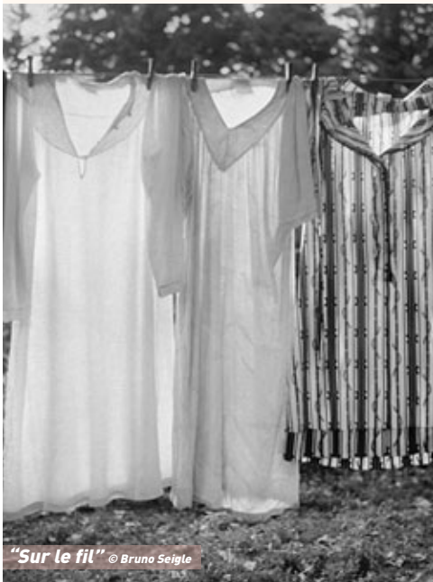
“Sur le fil” © Bruno Seigle

• Jusqu'au 28 septembre à l'Abbaye de Bonnefont (31/Propriary, 05 61 98 28 27)