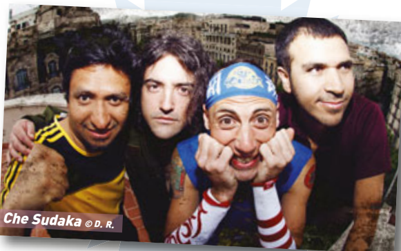
Che Sudaka