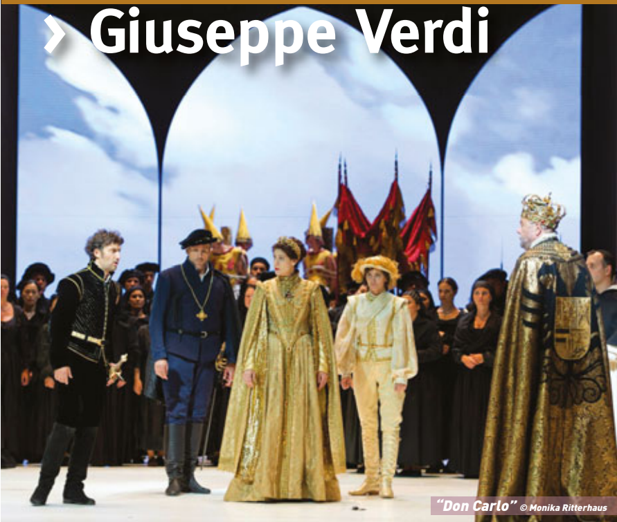
"Don Carlo"

Pour leur rentrée, le Théâtre du Capitole et les saisons d'opéras sur grand écran affichent des œuvres du compositeur italien.