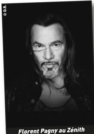
Florent Pagny au Zénith