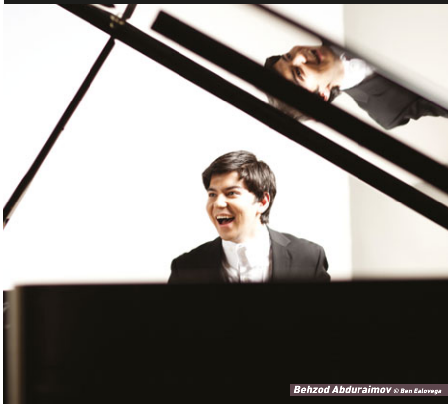
Behzod Abduraimov